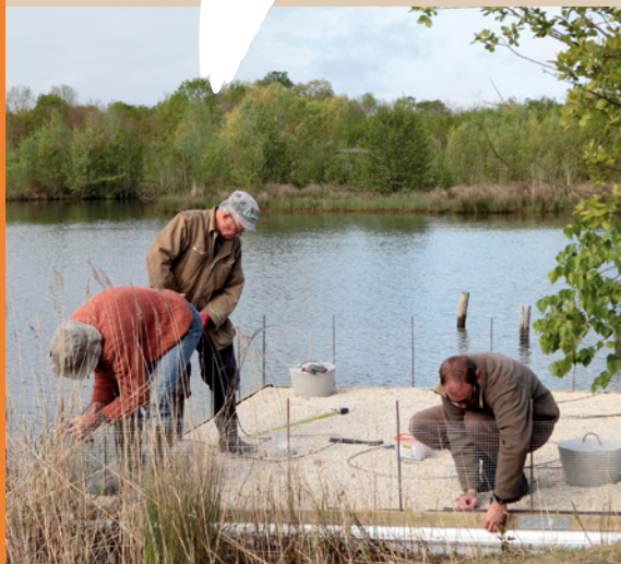
Aménagement d'un radeau à sternes sur le site de Saint-Cyr