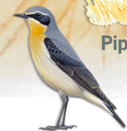
● Traquet motteux