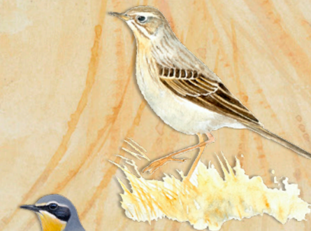
● Pipit rousseline

il niche à même le sol. Le pipit rousseline et le traquet motteux sont deux passereaux migrateurs qui vivent dans les milieux ouverts. Le pipit niche au sol, à l'abri d'une touffe de végétation, tandis que le traquet place son nid dans un tas de pierres ou une anfractuosité.