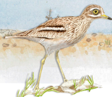
● Œdicnème criard