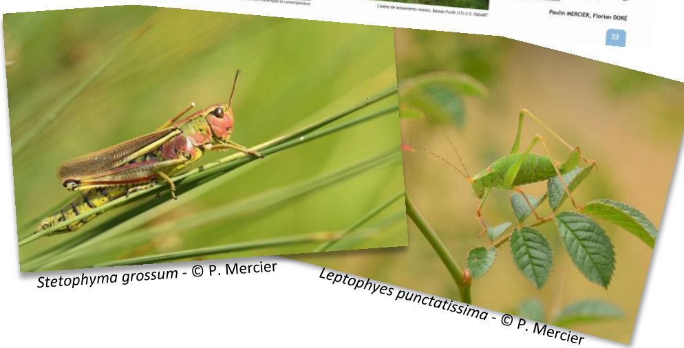
Stetophyma grossum