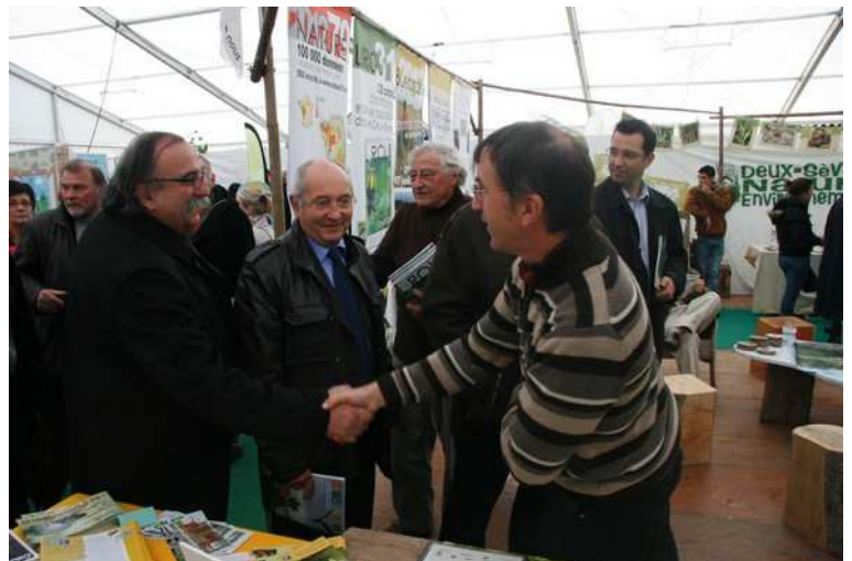
Le Président du Conseil Général des Deux-Sèvres devant le stand PCN à Ménigoute