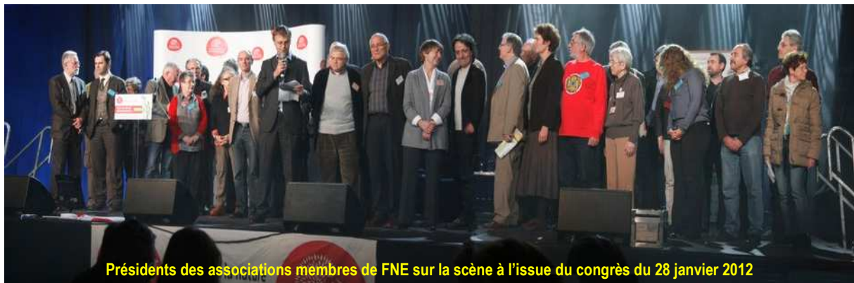
Présidents des associations membres de FNE sur la scène à l'issue du congrès du 28 janvier 2012