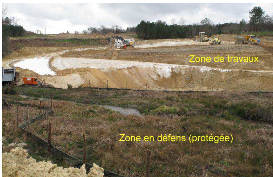
Zone travaux de La Poussone, Lot 13 (Charente-Maritime) – Photo Clémentine DENTZ

A saluer : la transition assurée haut la main par notre désormais coordonnatrice LGV, Clémentine, au départ de Christian Grimault et le passage de relais en douceur à