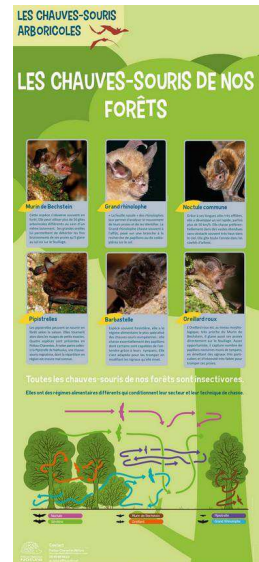
Un des cinq panneaux d'exposition du programme chauves-souris forestières