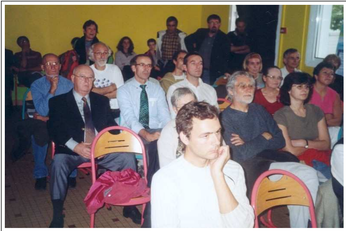
Un nombreux public