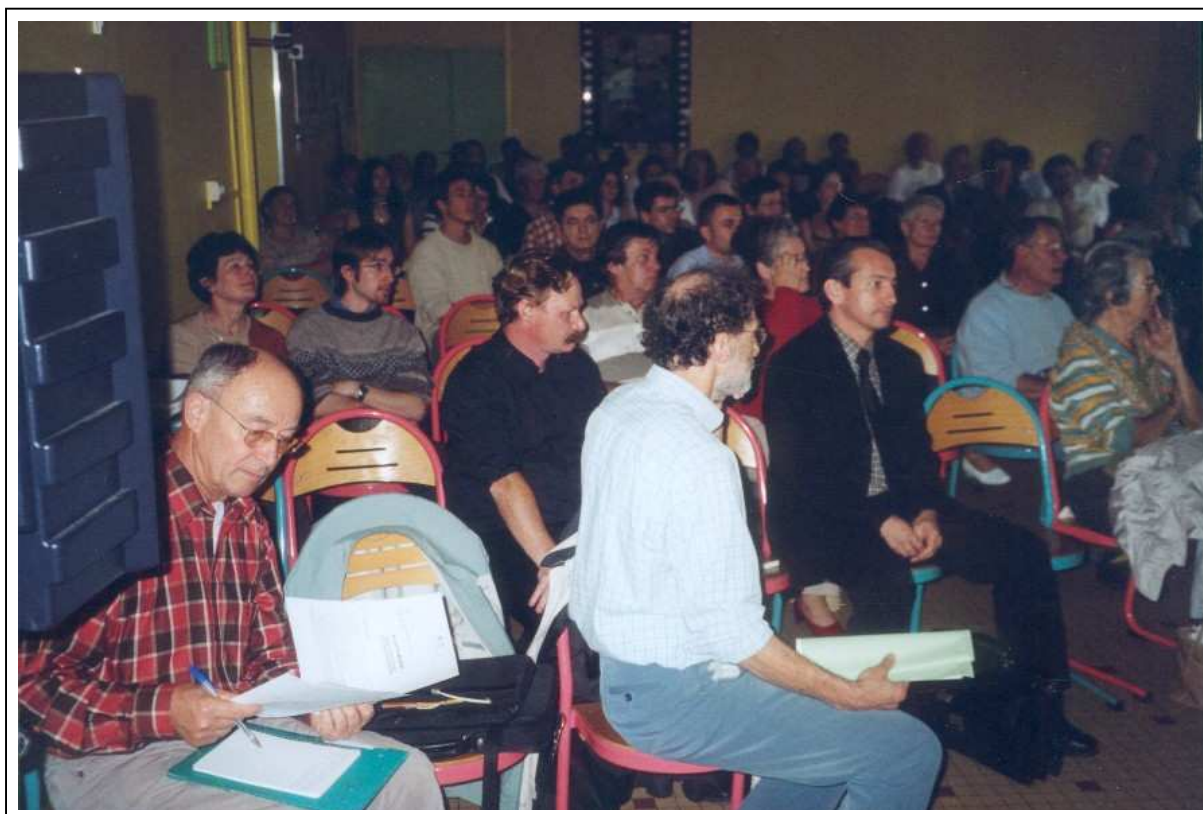
Les animateurs prêts à répondre aux questions