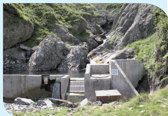
Gourette (64) prélèvement sur le Valentin

La station de Gavarnie 4 pompe l'eau directement dans le ruisseau d'Holle. Ce prélèvement suscite d'autant plus d'interrogations sur l'impact pour l'écoulement du torrent qu'un ouvrage EDF en amont ne laisse passer qu'un débit réservé pendant toute la saison hivernale. Le débit annoncé par EDF, à la centrale de Pragnères, est de 6 l/s, soit 21,6 m 3 /h et la puissance de pompage dans le torrent pour l'alimentation des canons est de 40 m 3 /h. Ainsi, le débit consenti par EDF dans le cours d'eau lors des prélèvements est inférieur à la puissance du pompage qui alimente le réseau neige de culture.