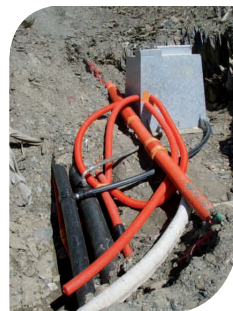
Equipements de canons à neige Peyresourde Balestas (65)