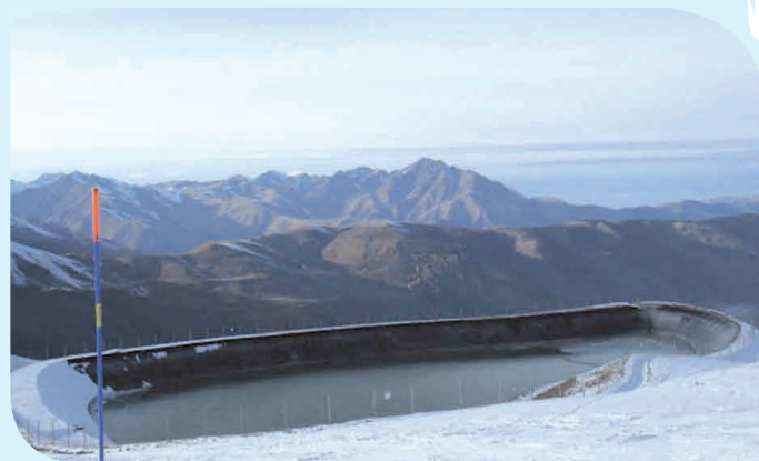
Retenue 66 000 m 3 , un point dur visuel

A titre d'exemple, l'extension du domaine skiable de la station Font-Romeu-Pyrénées 2000 avec la construction de 3 usines à neige met en péril 55 ha de zone humide de type tourbière, soit 5,25% des surfaces connues de ce type dans le département des Pyrénées-Orientales. De plus l'extension de domaine skiable va de pair avec une augmentation du salage des routes préjudiciable à la flore et à la faune (Desman des Pyrénées).