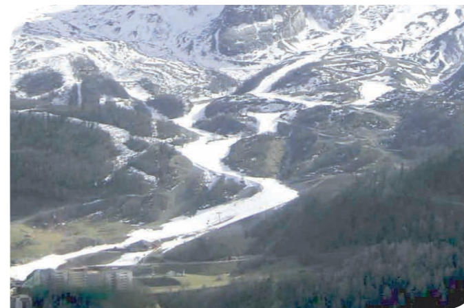
Gourette (64), piste des Rhododendrons enneigée artificiellement dans sa globalité

Dans les 18 stations, le volume prélevé est supérieur à 2 millions de m 3 sur un massif recouvrant 29500 km 2 . Comparativement, les 119 stations recensées lors de l'étude sur le bassin Rhône- Méditerranée- Corse en 2002 prélevaient 10 millions de m 3 pour un bassin hydrographique recouvrant un territoire de 130 000 km 2 .