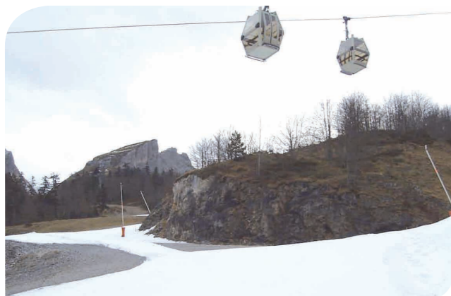
Couverture de neige artificielle sur terrain nu, Gourette

afin de faciliter la décroissance des nuisances sur les écosystèmes et permettre la reconversion de ce modèle touristique insoutenable et incompatible avec le dérèglement climatique annoncé. Par exemple : maîtriser l'étalement urbain avec la mise en place d'outils réglementaires : stabilité des documents d'urbanisme à une échelle pertinente dans le temps (10-15 ans) et dans l'espace (vallée, « pays »), renforcement du principe de construction en continuité, interdiction de toutes nouvelles liaisons inter-stations, moratoire sur l'extension des domaines skiables, législation foncière favorable à l'habitat permanent, fiscalité favorable aux communes préservant leur patrimoine naturel.