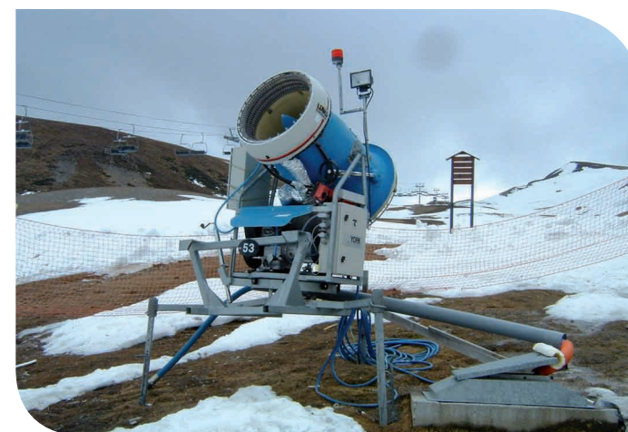
Canon à neige - Peyragudes (65)

L'emballlement des « résidences de tourisme » inconsidérément favorisées par des mesures fiscales (dites Demessine) est à mettre en parallèle avec l'extension des domaines skiables et des usines à neige. La poursuite des unités touristiques nouvelles, complètement déconnectées du marché mais assurées d'avantages fiscaux, de financements publics par l'Etat (pôles touristiques), de subventions régionales ou départementales (canons à neige) contribue à la non maîtrise de l'étalement urbain (problème d'assainissement). Les stations doivent gérer des pôles d'urbanisation aux demandes sociales de plus en plus contradictoires : centre ancien de village, station de ski satellite, urbanisation pied de piste, Unités Touristiques Nouvelles (UTN) ou résidence de promoteur à l'écart ... Tout cela psychologiquement fondé sur l'assurance d'une neige éternelle.