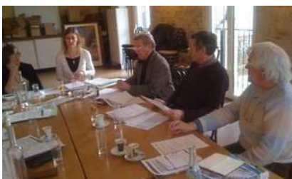
Signature de la charte Ass'Eau BAG par les différents représentants