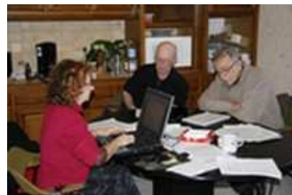
Réunion de travail au siège de Poitou-Charentes Nature pour finaliser les textes

précédentes ; bon nombre d’entre elles ont en effet fait l’objet de décisions et d’actions menées par le Conseil Régional mais aussi par des acteurs publics ou privés. D’autres n’ont pas émergé ou ont fait l’objet d’une mise oeuvre modeste, nous les avons donc reprises.