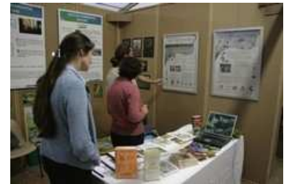
Stand de Poitou-Charentes Nature au forum des acteurs de l'environnement

Le grand public s'est quant à lui déplacé en nombre le samedi après-midi.