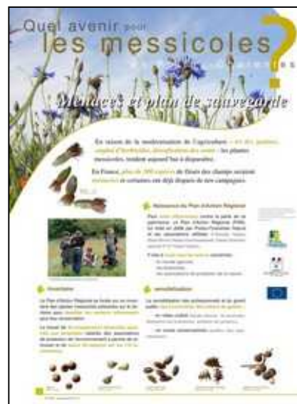
les panneaux messicoles